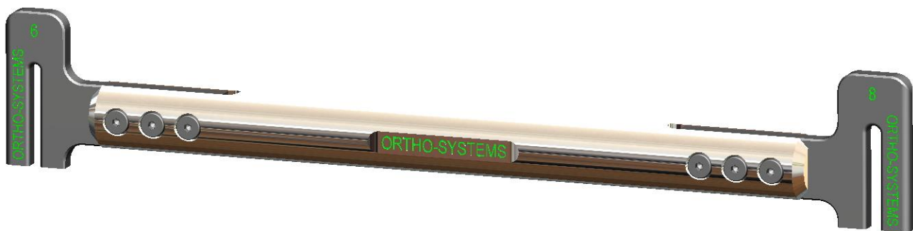
Hand- Schränkeisen doppelt